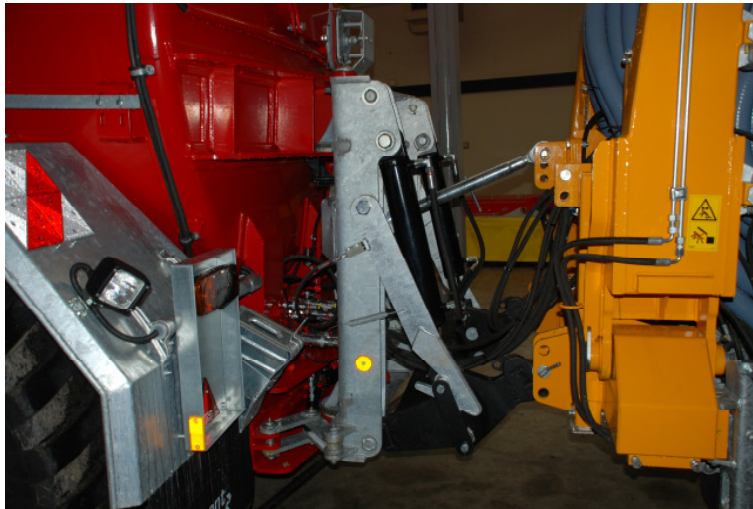
Bild 1: Schwenkbares Dreipunkt-Hubwerk in verstärkter Ausführung für Garant Güllewagen.